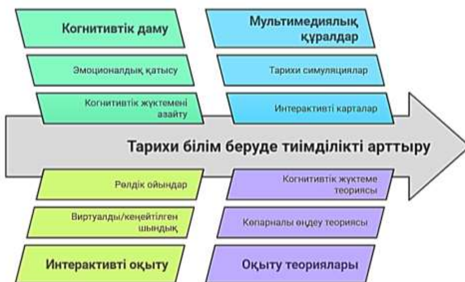
1-сурет – Мультимедиялық және интерактивті технологиялардың тарихи білім берудегі тиімділігі

Виртуалды шындық технологиялары тарихи оқиғаларды иммерсивті форматта зерттеуге мүмкіндік береді. VR құралдарының көмегімен оқушылар тарихи шайқастарды, маңызды оқиғаларды, мәдени-өркениеттік дамудың кезеңдерін тереңірек зерттей алады. Кеңейтілген шындық технологиялары дәстүрлі оқу материалдарын мультимедиялық элементтермен толықтырып, тарихи деректерді анағұрлым көрнекі түрде ұсынуға жағдай жасайды. Сонымен қатар, тарихи симуляциялар мен рөлдік ойындар білім алушыларға тарихи оқиғаларға тікелей қатысушы ретінде енуге мүмкіндік беріп, тарихи процестердің күрделілігін жақсы түсінуге көмектеседі [4].